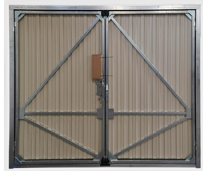
Stahlkonstruktion (schräge Ausführung)