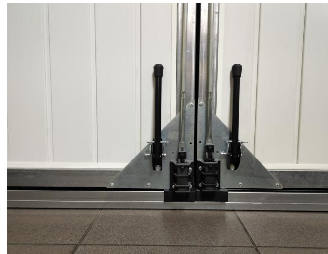
Schnapper aus Kunststoff