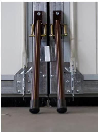
Schnapper aus Metall