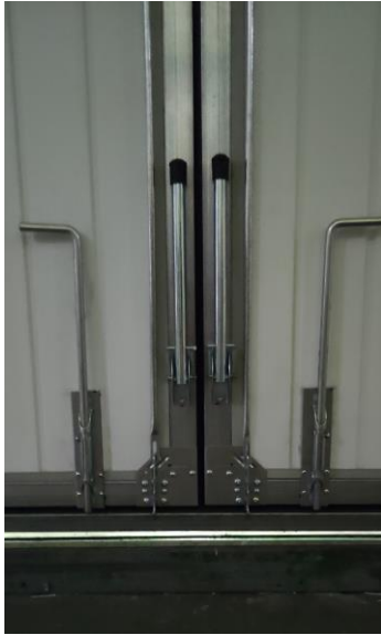
Türstopper (bei Sonderausführung) 520mm