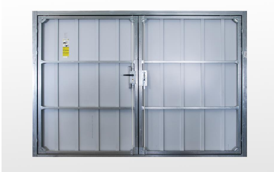
Stahlkonstruktion (waagrechte Ausführung)